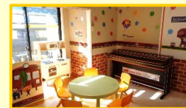
[ 中央の部屋 ① ]