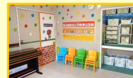
[ 中央の部屋 ② ]