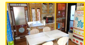
[ キッチン ]