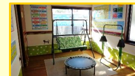
[ 運動部屋 ]