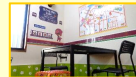
[ 勉強室 ]